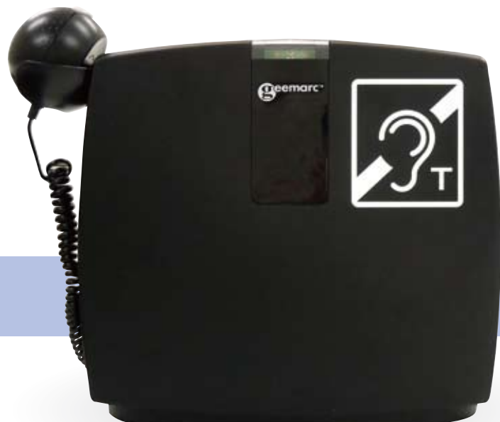
卓上型磁気ループシステム S-101

セットアップもとてもカンタン!! ピクニックや散歩など、屋外に持ち出して使用することも可能です。